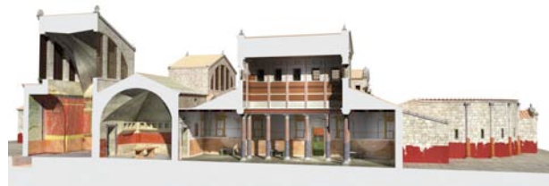
Sección longitudinal de las termas de Clunia

Edificio termal de esquema simétrico, con los ámbitos principales desdoblados a partir de un eje longitudinal, dejando un espacio exterior en el centro donde se solía situar la piscina (natatio). El acceso principal, un pórtico semicircular columnado, comunica con un exterior, calle o plaza, porticado. El conjunto muestra claramente diversas fases y reutilizaciones, prolongándose estas últimas hasta el siglo V d.C.