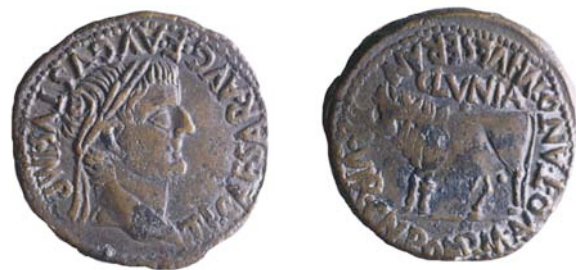
As de Tiberio acuñado en Clunia

Clunia pervive hasta fines del s. VII pero su importancia en época visigoda decae, como parece demostrar su desaparición de las fuentes literarias, la carencia de ceca y la instauración de una sede episcopal en Uxama.