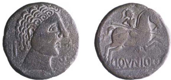
As Ibérico CLOVNIQ