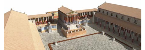
Cabecera del Foro de Clunia

Se trata de una Plaza pública de grandes dimensiones diseñada, no sólo para el municipio, sino para reunir en momentos señalados a ciudadanos de todo el Convento Jurídico. En él se desarrollan las actividades que marcan la vida de un ciudadano romano. La función religiosa se sitúa en la cabecera del foro, presidida por el Templo de Júpiter. La función comercial se desarrolla en el espacio central, una plaza porticada, donde hay pequeños locales denominados tabernas y con espacio bajo el pórtico para venta ambulante. La función jurídica se desarrolla en los pies del foro en un edificio llamado Basílica, gran espacio cubierto donde se resuelven los pleitos y sancionan contratos; también sirve para guardar las leyes y de registro. En su condición de Convento Jurídico, la basílica servía, una vez al año, para recibir al Gobernador de la Provincia (Hispania Citerior) y celebrar juicios relativos al territorio de todo el convento.