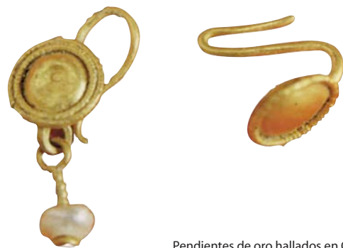
Pendientes de oro hallados en Clunia