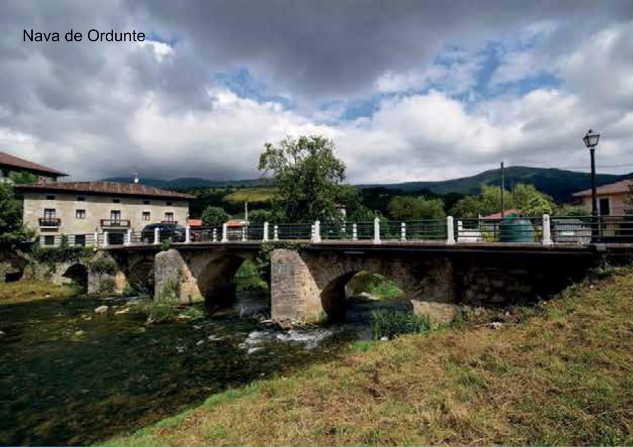
Nava de Ordunte