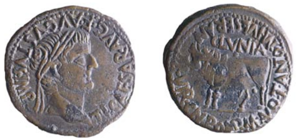
As de Tiberio acuñado en Clunia

No se conoce con exactitud el emplazamiento de la ciudad arévaca; en los alrededores se documentan restos de asentamientos prerromanos.