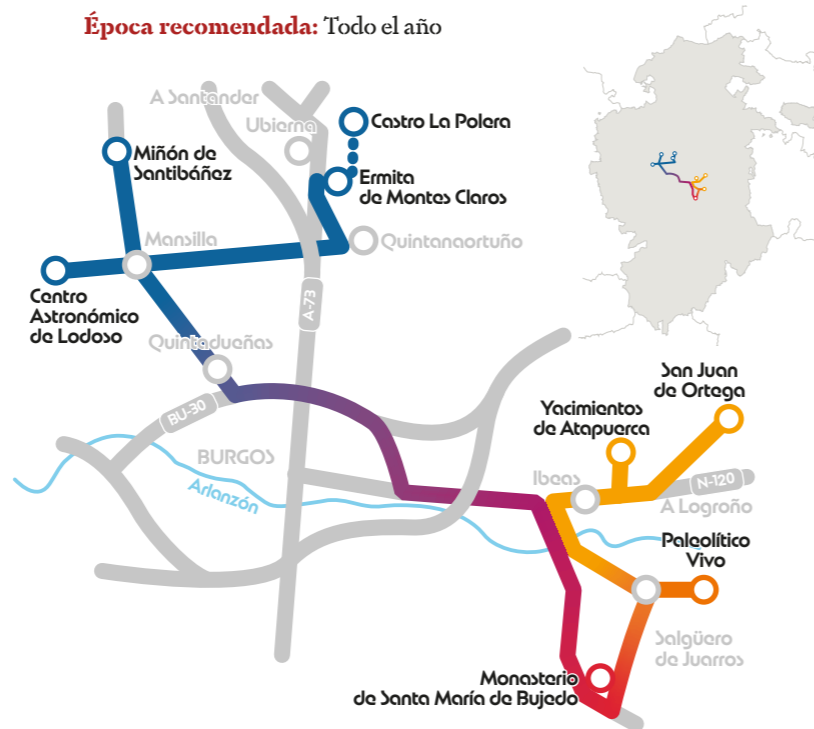
Yacimientos de Atapuerca