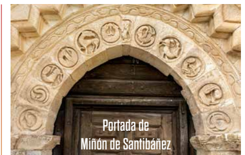
Portada de Miñón de Santibáñez

Para llegar al siguiente enclave hay que seguir de nuevo hacia el oeste, perfilar la ciudad de Burgos y ascender hasta lo alto del páramo donde se ubica el Centro Astronómico de Lodoso , certificado como Parque Estelar Starlight y que cuenta con varios observatorios desde los que contemplar el cielo con una mirada científica.