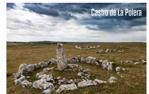
Castro de La Polera