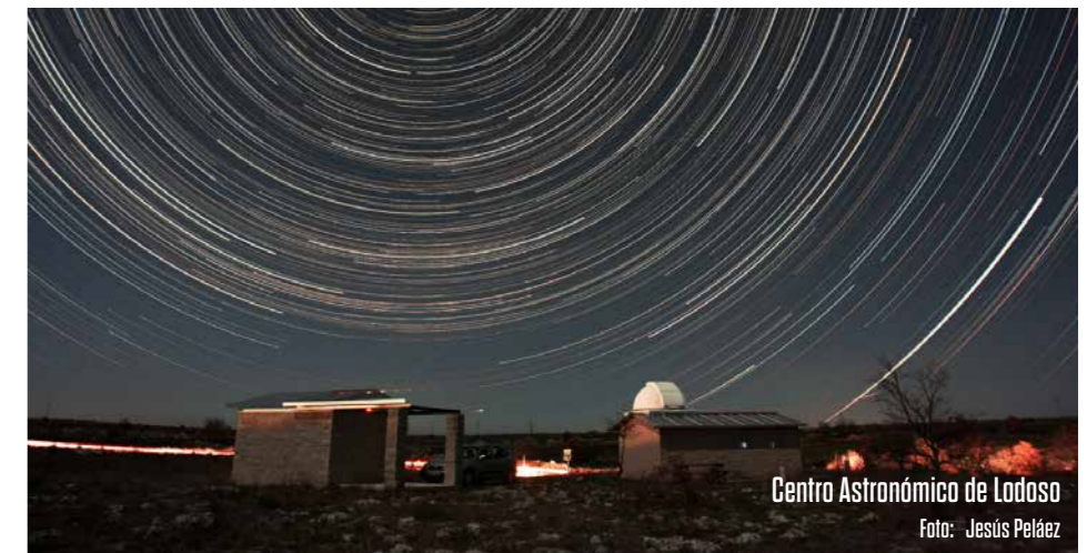
Centro Astronómico de Lodoso

Los peregrinos que se dirigían hacia la tumba del Apóstol siguiendo la simbólica senda celeste de la Vía Láctea se encontraban, al llegar al enclave burgalés, con una iglesia en la que acontecía el prodigioso Milagro de la Luz equinoccial iluminando un bello capitel románico.