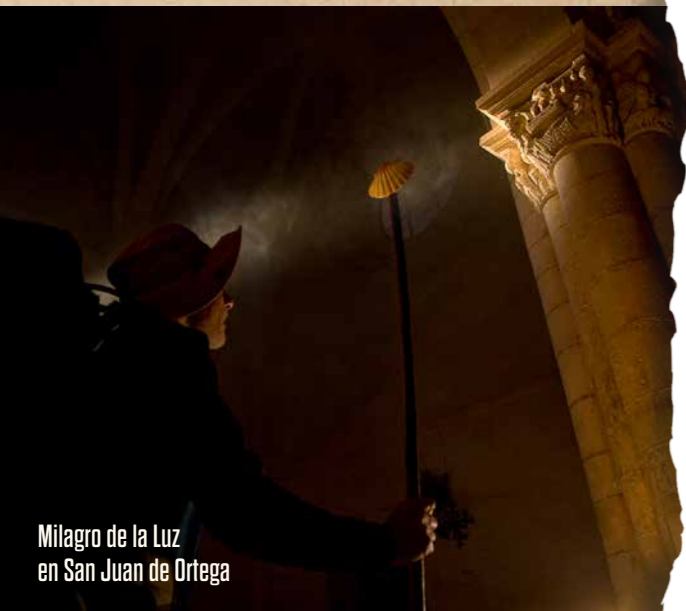
Milagro de la Luz en San Juan de Ortega

Por encargo de la reina Isabel la Católica, muy devota del santo burgalés, estos artistas de origen germano —con elevados conocimientos matemáticos y de astronomía adquiridos durante su formación en su Colonia natal— restauraron la deteriorada iglesia monacal, introduciendo las reformas necesarias para permitir que los rayos solares iluminaran un bellissimo capitel románico.