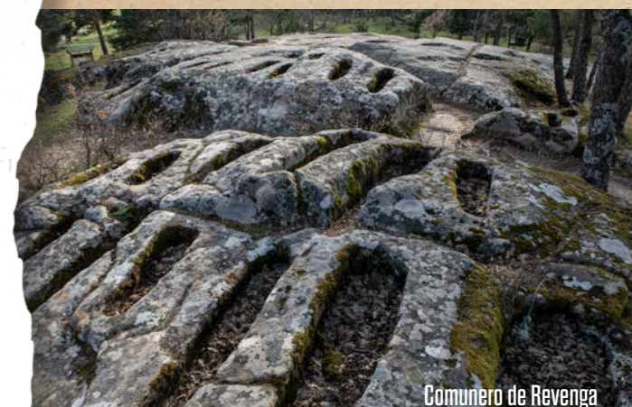
Comunero de Revenga