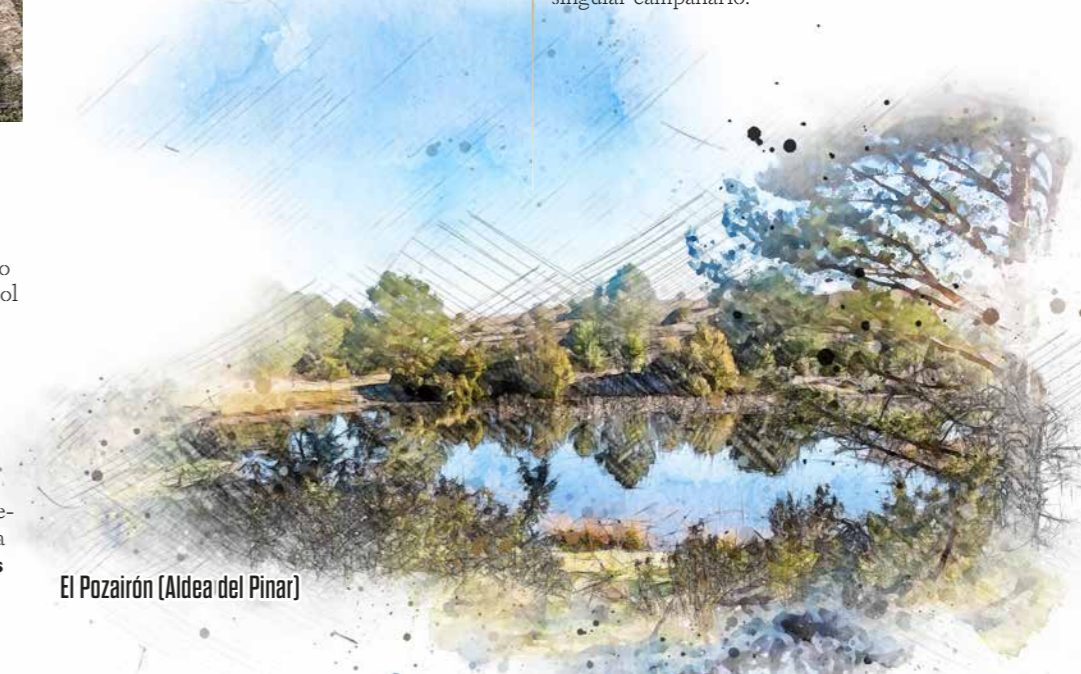
El Pozairón (Aldea del Pinar)

En Pineda de la Sierra destaca la elegante galería porticada de su iglesia románica, orientada al mediodía y abierto al valle del Sol en las faldas del pico Mencilla.