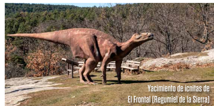
Yacimiento de icnitas de El Frontal (Regumiel de la Sierra)