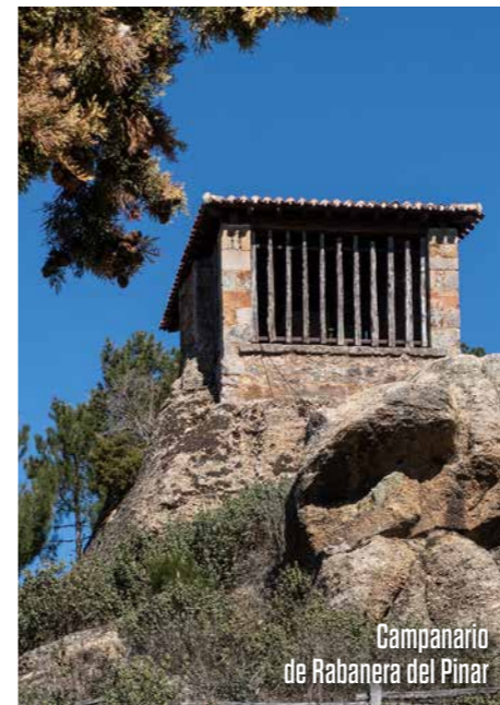
Campanario de Rabanera del Pinar

En estas montañas, las laderas en solana, las peñas sagradas, las lagunas aisladas, los antiguos asentamientos y el pasado trashumante evidencian hasta qué punto la luz solar, las creencias sobre el más allá y la observación del firmamento han condicionado la vida de sus habitantes.