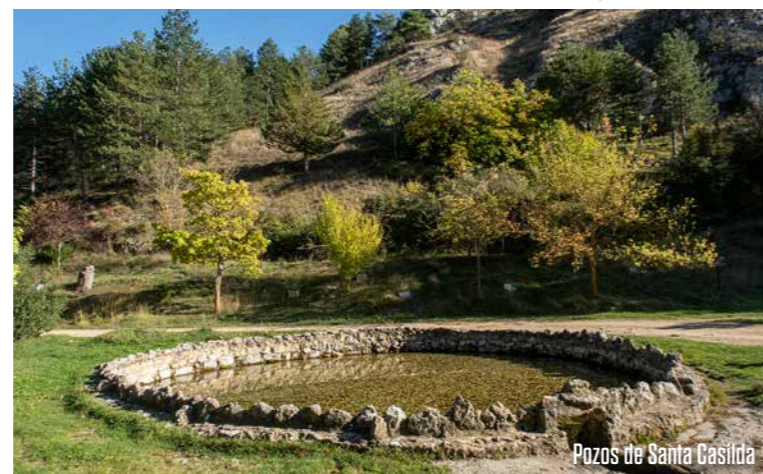
Pozos de Santa Casilda