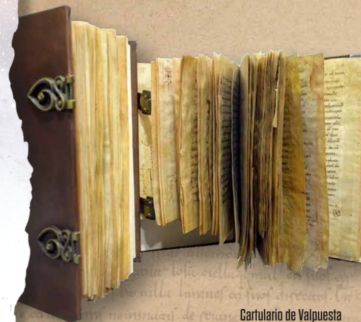
Cartulario de Valpuesta

Por esas coincidencias del destino, este Cartulario de Valpuesta , que recopila 187 documentos fechados entre los siglos IX y XIII, ha sido reconocido por la Real Academia Española como el documento más antiguo en el que aparecen escritos los baluceos de la lengua castellana .