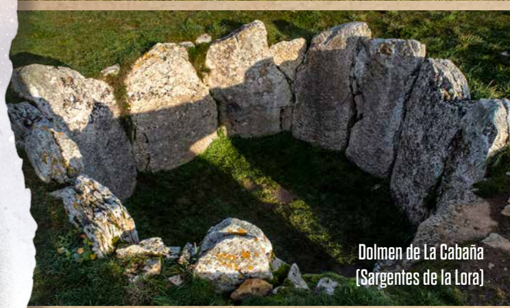
Dolmen de La Cabaña (Sargentos de la Lora)