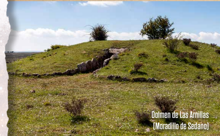
Dolmen de Las Arnillas (Moradillo de Sedano)