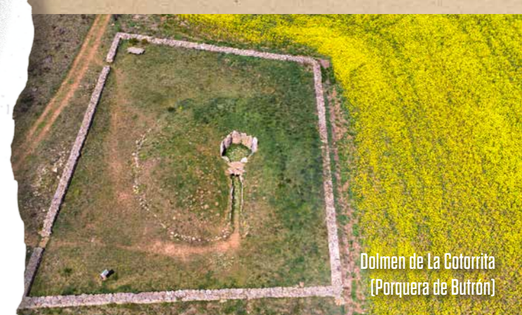
Dolmen de La Cotorrita (Porquera de Butrón)