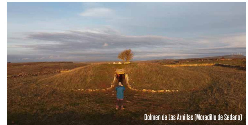
Dolmen de Las Arnillas (Moradillo de Sedano)

La siguiente parada será cerca de Gredilla de Sedano, en una tradicional y bien conservada hornillera para las abejas, unos imprescindibles insectos polinizadores que orientan su vuelo siguiendo la posición del sol.