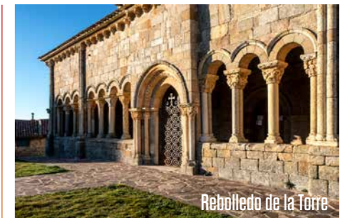
Rebolledo de la Torre

A continuación se alcanza Rebolledo de la Torre, con una maravillosa galería románica que despliega un completo programa iconográfico con una visión ordenada del mundo. Todo ello reforzado por la presencia del Árbol del Bien y el Mal como eje simbólico.