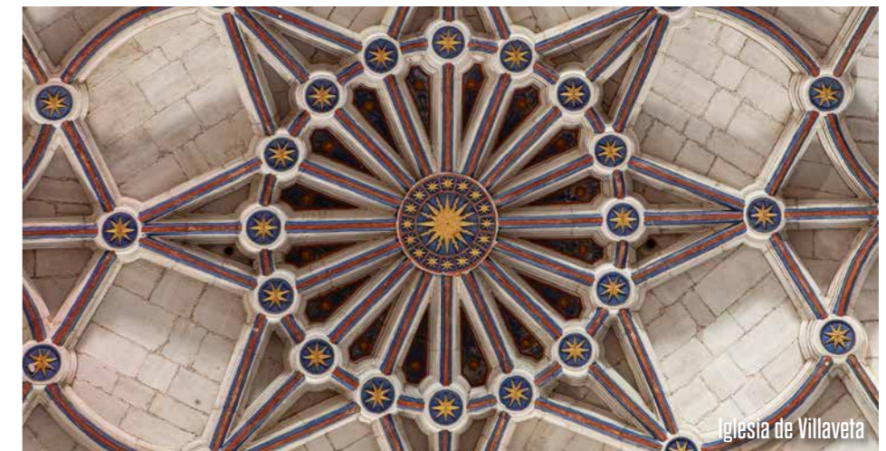
Iglesia de Villaveta

Esta ruta propone una lectura del patrimonio de las comarcas del oeste burgalés desde su relación con el cosmos, incorporando además el singular marco del Geoparque de Las Loras como elemento de referencia paisajística. A través de distintos hitos arqueológicos, artísticos y patrimoniales y de alguna hierofanía solar, el itinerario revela cómo las distintas culturas que han poblado el territorio fueron interpretando y asumiendo los fenómenos astronómicos como fuente de conocimiento , trazando un vínculo profundo entre la tierra y el cielo.